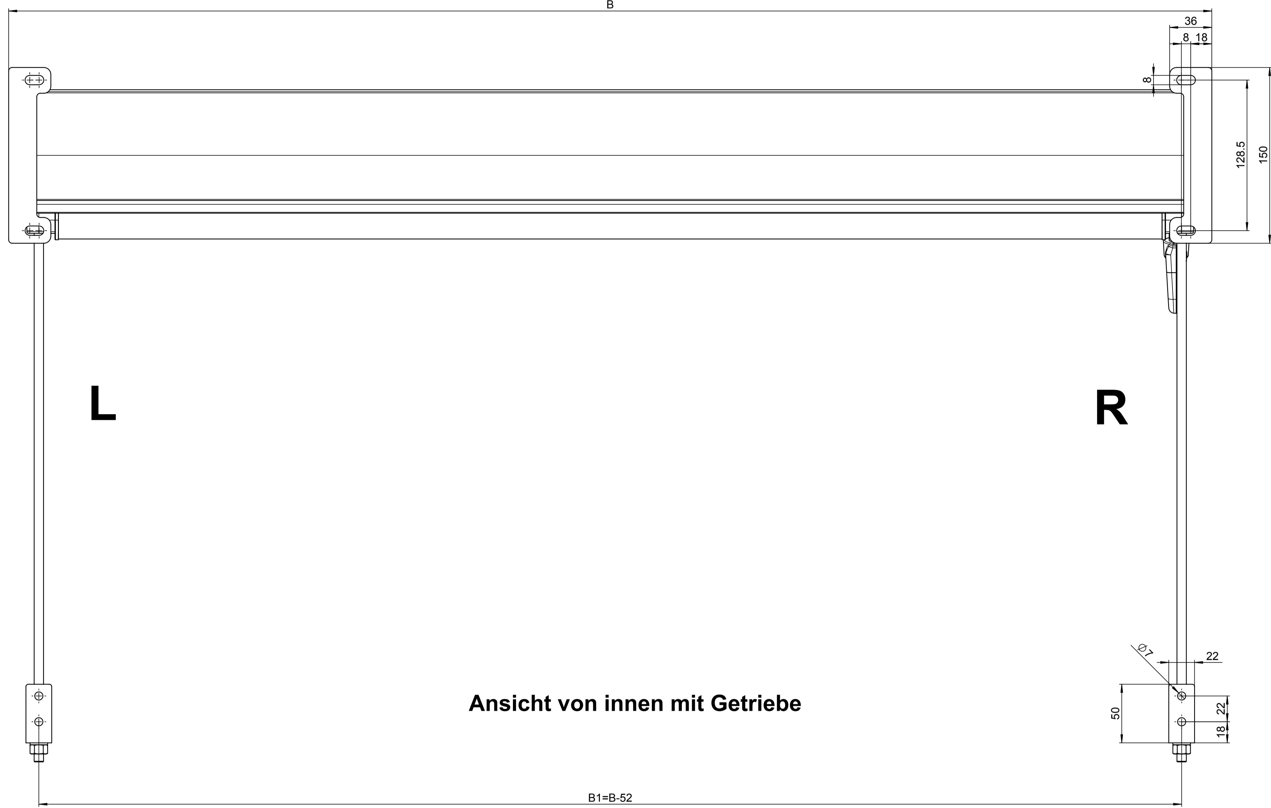
Ansicht von innen mit Getriebe

Allgemeine Abmessungen für maschinell bearbeitete Teile: Längen- und Winkelmaße ISO 2768-mK