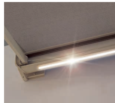
Illuminazione a LED