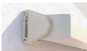
Design quadro o tondo