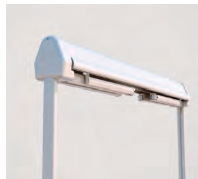
Tettuccio di protezione integrato