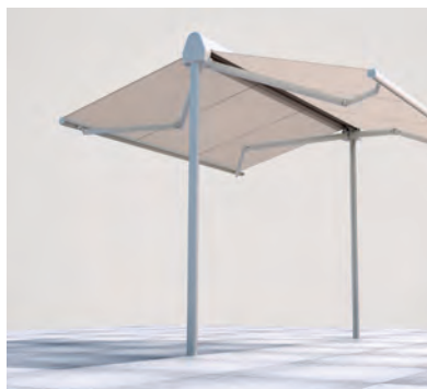
Tubolare da interrare