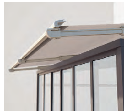
PS6100 Ausfahrbare Ausladung