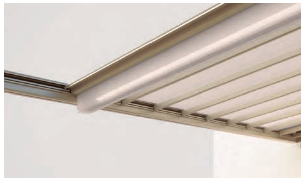
Tuch in Seitenführung