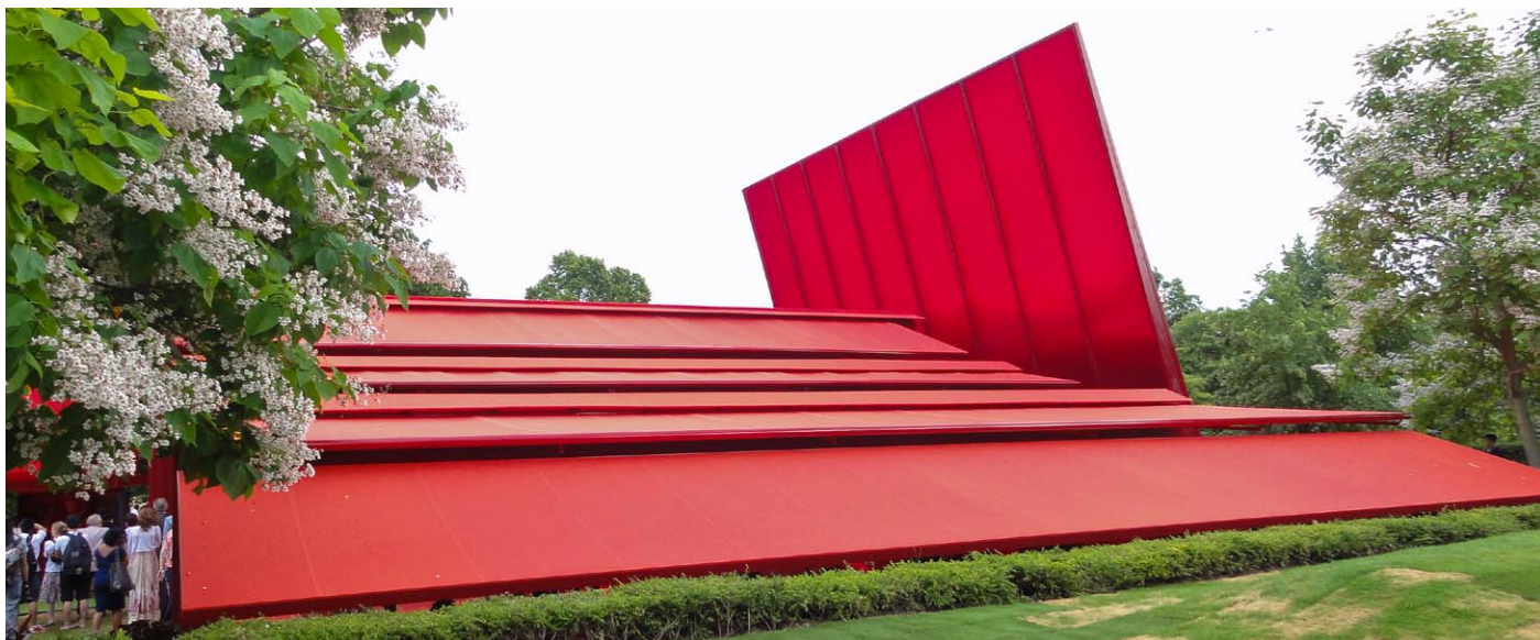
Der Serpentine Gallery Pavilion mit den STOBAG JUMBO-Markisen kann noch bis Ende Oktober im Kensington Park in London bestaunt werden.