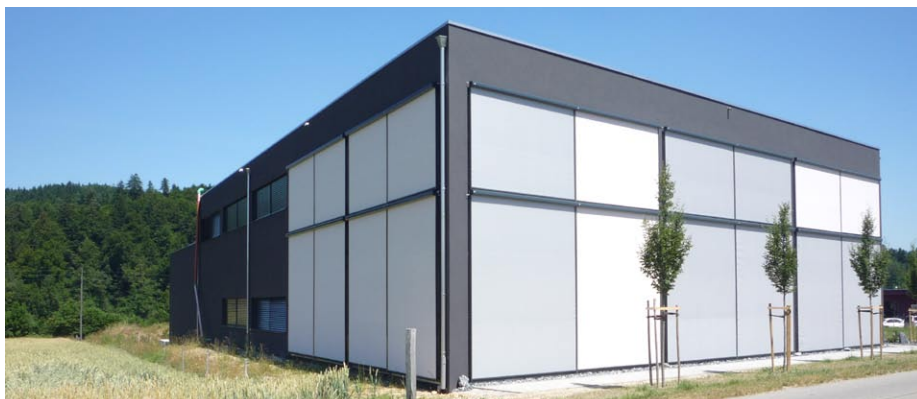
VENTOSOL: Ästhetische und windstabile Senkrechteschattung mit integrierter Tuchführung

Weitere Informationen finden Sie unter: www.stobag.com