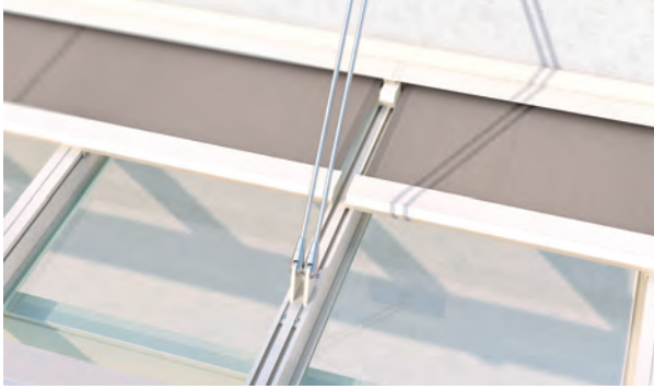
Kopplung mit Zugstange