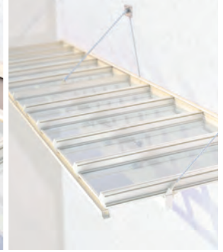
Dachverglasung mit und ohne Beschattung